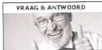
VRAAG & ANTWOORD