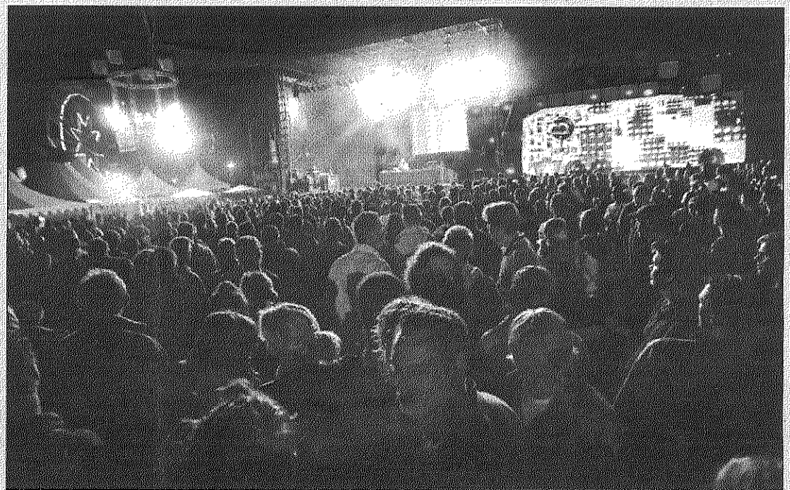
's Avonds stroomde Terlaemen vol voor een fuif tot in de vroege uurtjes.